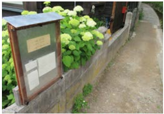
▲小川の横をまっすぐ進んだところにお店があります。

これからもゆっくり少しずつ丁寧に、この土地に感謝をしながらお店を育てていきたいと思っております。川涼みのついでにぜひお気軽にお立ち寄りください。